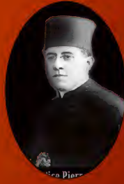
Justice Pierre Craibites